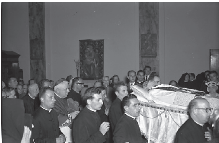
Processione con le spoglie del “Servo di Dio”