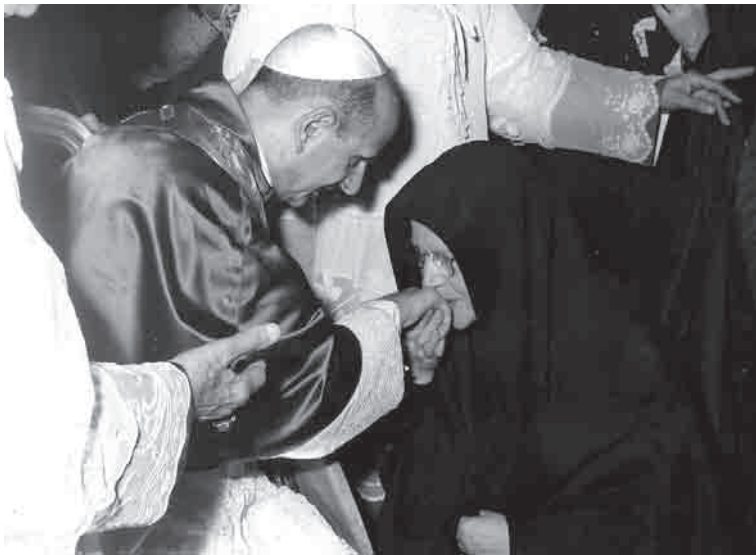
Paolo VI e Madre Angela Cettini, Superiora Generale delle FSMP nel giorno della Beatificazione