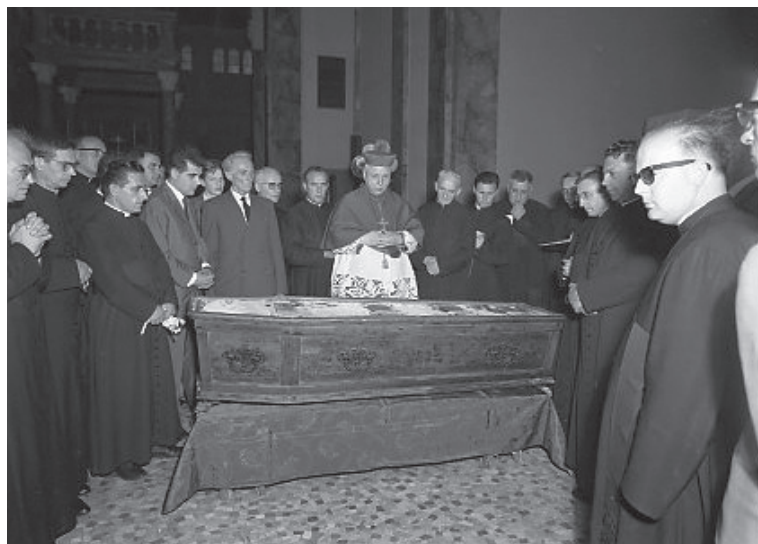
Il vescovo di Como durante la ricognizione canonica