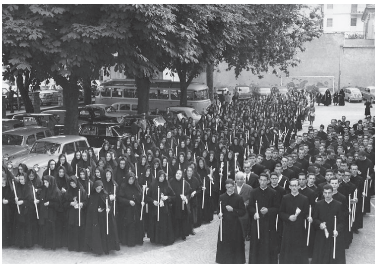
Figlie di S. Maria della Provvidenza e Servi della Carità nel giorno della ricognizione canonica