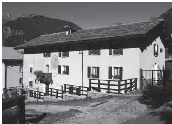
Fraciscio - Casa natale

(L. Guanella, Quarto Centenario dalla traslazione del corpo di San Rocco , p. 429)