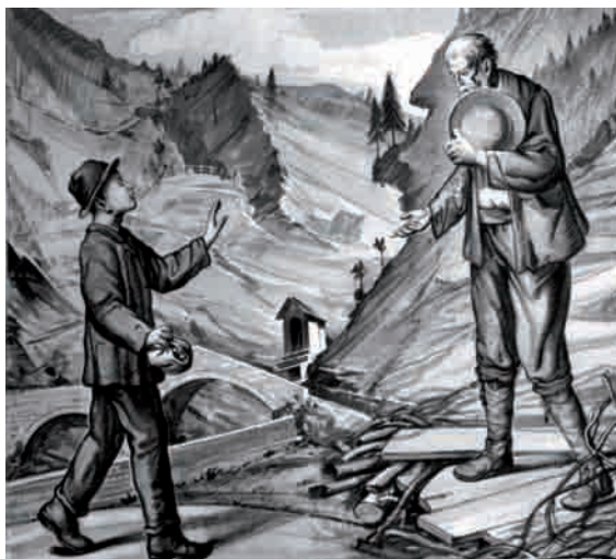
Visione del vecchietto a Campodolcino. Affresco del Conconi. Chiesa S. Rocco di Fraciscio.

A Gualdera sul motto del vento. Affresco del Conconi. Chiesa S. Rocco di Fraciscio